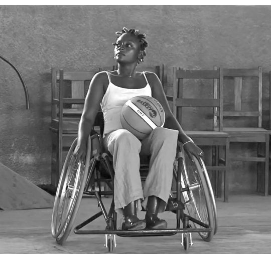
Image tirée de la bande d'annonce du documentaire « En route pour le milliard »

Entre le 5 et le 10 juin 2000, la « guerre des six jours » fait plus de mille morts à Kisangani et dans ses environs. Depuis plus de vingt ans, des victimes de cette ville de la République démocratique du Congo (RDC) demandent réparation et justice.