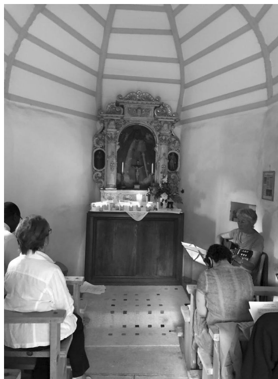
Charmey