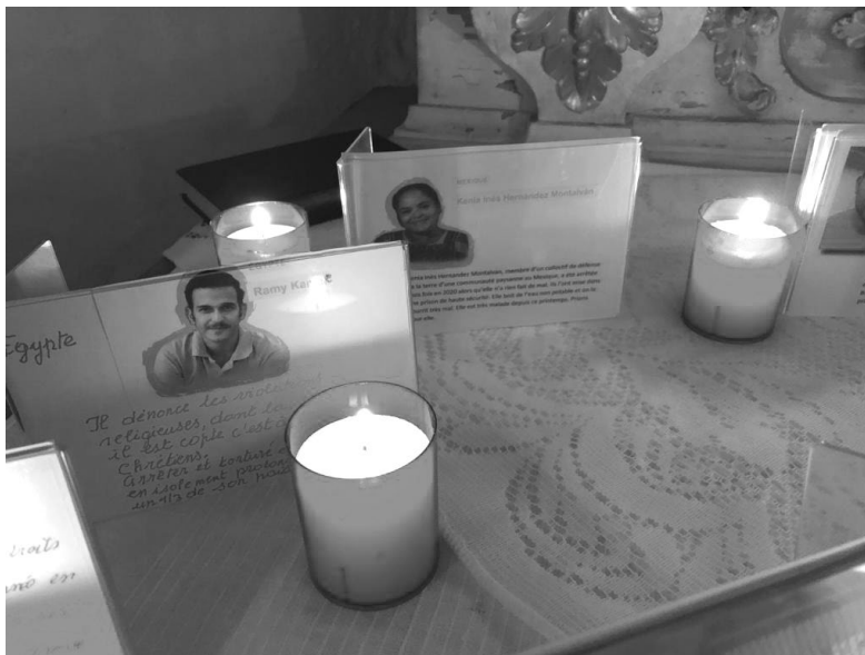
La Nuit des Veilleurs 2021 à Charmey

Malgré les restrictions toujours en vigueur dans le contexte de la pandémie, de nombreuses personnes en Suisse ont participé cette année encore à la chaîne internationale de prières, et écrit des messages de soutien à des victimes de la torture. Nous avons beaucoup apprécié les nouvelles et les photos que vous nous avez fait parvenir au sujet de vos événements.