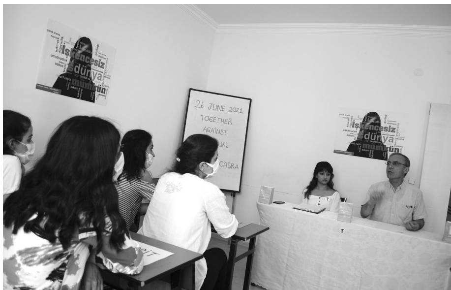
Le 26 juin à Diyarbakir, Turquie : des séminaires sur la prévention de la torture

traditionnel pique-nique du 26 juin, auquel SOHRAM invite toujours les victimes de la torture et de la guerre, a malheureusement dû être annulé en raison de la pandémie. En particulier pour les réfugiés syriens et leurs familles, le pique-nique offre généralement l'occasion d'oublier, le temps d'une journée, toutes les violences qu'ils ont subies. KDB